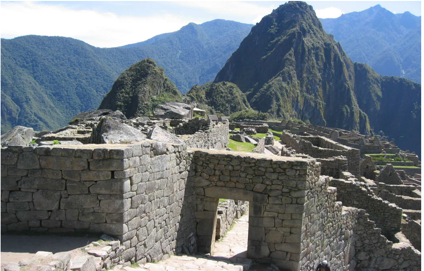
Machu Picchu mit dem Berg Huayna Picchu